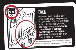
Обратная сторона карты дела

Нельзя просто гадать! Вы всегда должны найти конкретную сцену на карте города, подтверждающую ваши выводы.