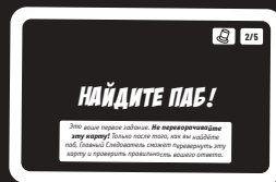
Лицевая сторона карты дела

• На лицевой стороне второй карты, теперь верхней в колоде, указано ваше первое задание в этом деле. Главный Следователь читает задание вслух, не переворачивая карту .