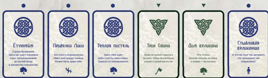
Карта ведущего, которая задала тему истории

2. Рассказчик берёт минуту на размышление, затем рассказывает историю, отвечая на поставленный вопрос. Он должен использовать 5 из 6 карт своей руки, выкладывая их по ходу рассказа в линию, начиная с карты вопроса.