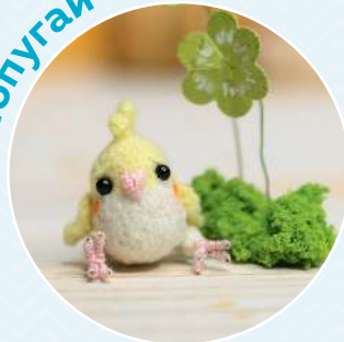
Попугай ■ 87