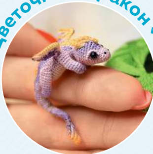
Цветочный дракон ■ 105