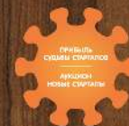
Жетон активного игрока