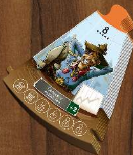
Сегменты игрового поля x 10