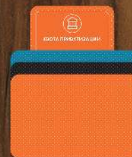
Карты событий, кризисов и опций x 112