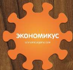
Центральный элемент игрового поля

Вам предстоит принимать множество решений с учётом действий и планов других игроков - в каких отраслях покупать компании и создавать стартапы, по какой цене, как и когда использовать игровые карты.