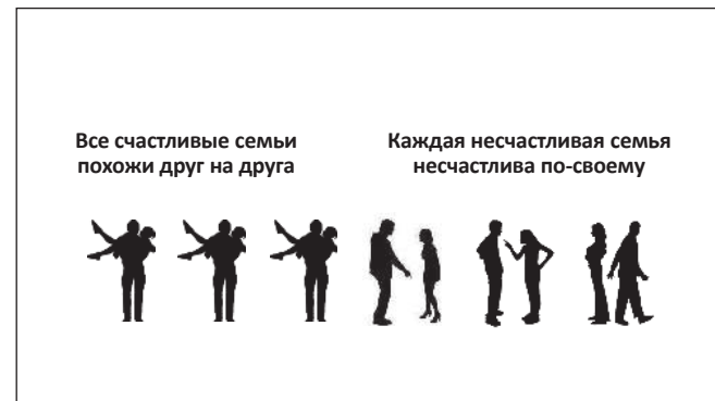
Рис. 4. Ещё одна бессмыслица.