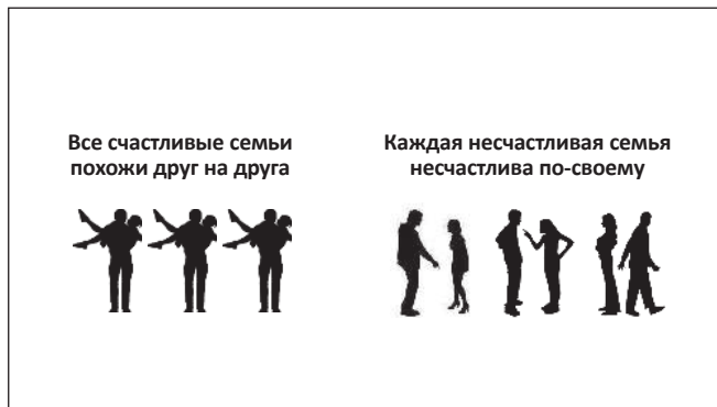
Рис. 2. Изображения счастливых и несчастных пар подчёркивают толстовскую мысль.

выразительность. Если бы мы смогли собрать две группы людей, говорящих по-русски, но в силу каких-то причин никогда не слышавших начальных строк «Анны Карениной», и показали группе А первый слайд (с оригинальной фразой), а группе Б – второй (с картинками), то, я уверен, такое исследование обнаружило бы: респонденты из группы Б на какие-то доли секунды быстрее понимают, о чём идёт речь. Так происходит потому,