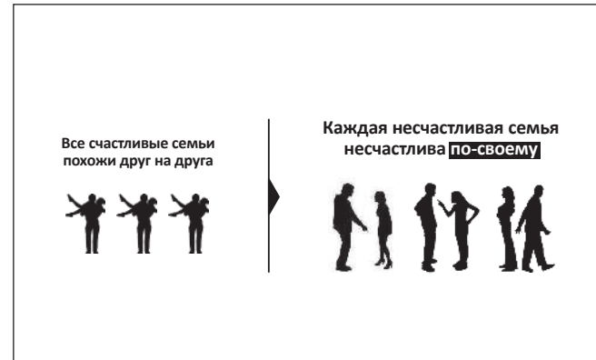
Рис. 8. Стрелка отражает новый поворот мысли: несчастные семьи не берутся из ниоткуда, что-то начинает происходить со счастливыми парами.

Мы адаптируемся к новой среде. Точно так же к ней адаптируются и тексты. Литера-