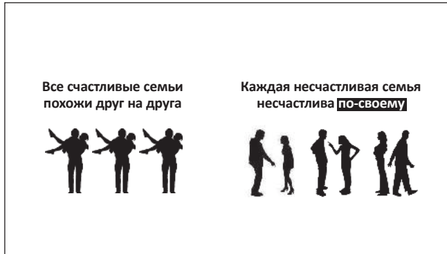
Рис. 5. Выделив всего одно слово, мы даём понять: речь пойдёт о том, что у разных пар – разные проблемы.

можем это подчеркнуть: например, выделить наречие «по-своему» (рис. 5) и даже уменьшить размеры левой части слайда (рис. 6). Правда, в получившейся композиции есть какая-то неловкость: она как будто хромотает на одну ногу. Чтобы уравновесить слайд, обозначим границы его правой части – более важной и потому занимающей больше пространства – фоном. Вот сейчас, кажется, всё встало на свои места (рис. 7). Теперь понятно: левая часть – только