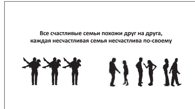
Рис. 3. Абсурдная композиция: она разрушает смысловые связи, возникшие между фрагментами фразы и изображениями.

Но продолжим. Для вымышленного спикера, как и для автора использованной им цитаты, разумеется, важнее вторая её часть. Мы