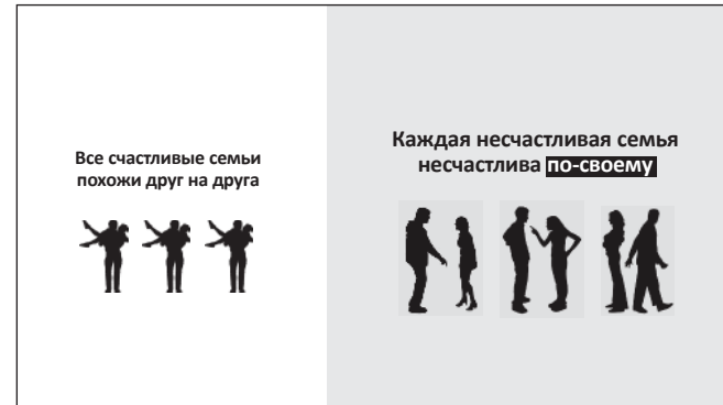
Рис. 7. После добавления второго фоновго цвета композиция стала чётче. Серая часть больше белой – в полном соответствии с размерами кегля и картинок.