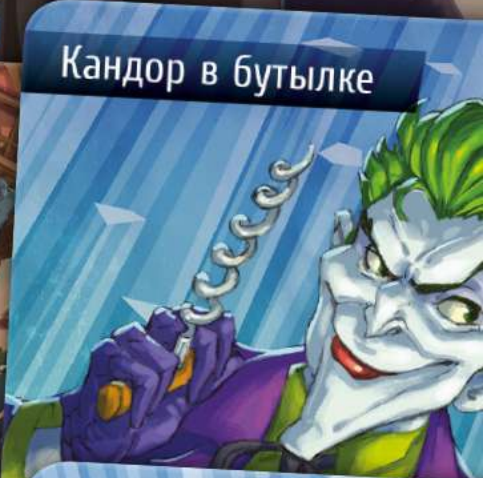
Кандор в бутылке