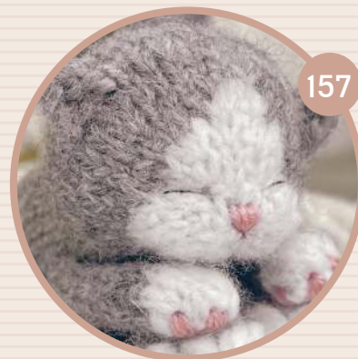
СПЯЩИЙ КОТЕНОК СПУН