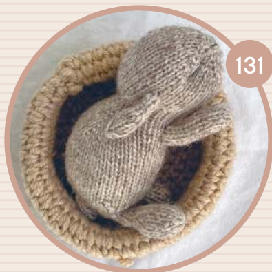
СПЯЩИЙ ЗАЙЧОНОК БЕННИ