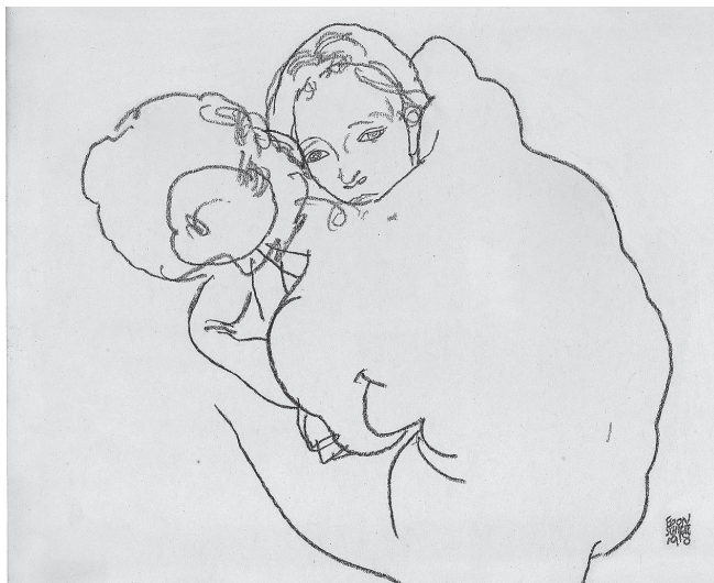
Мать и дитя. Рисунок карандашом Эгона Шиле, 1918.