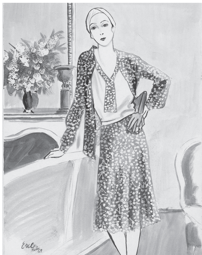
Стильный портрет работы Эрика.

Главная цель этой книги — помочь вам обрести свой собственный стиль, такой же уникальный и неповторимый, как и руки, которыми вы будете создавать свои рисунки. Хотя все упомянутые мной художники творили в единой эстетике, каждый из них шел своим собственным путем, поэтому возьмите понемногу от каждого — это поможет вам найти свое место в мире искусства изображения моды.