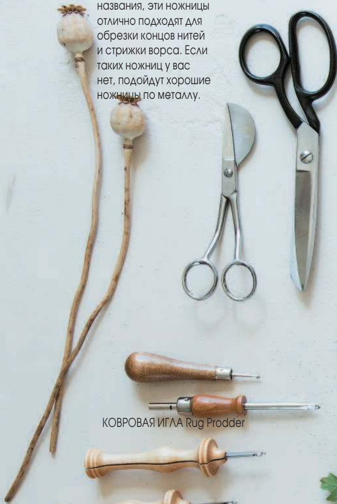
КОВРОВАЯ ИГЛА Rug Prodder

Ножницы для стрижки ворса | Как следует из названия, эти ножницы отлично подходят для обрезки концов нитей и стрижки ворса. Если таких ножниц у вас нет, подойдут хорошие ножницы по металлу.