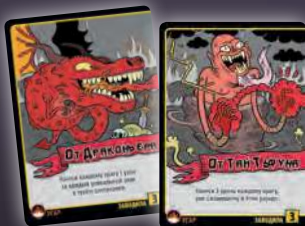
ЗАВОДИЛА + ЗАВОДИЛА