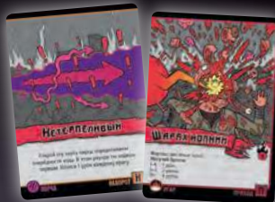
НАВОРОТ + ПРИХОД