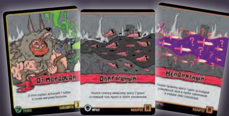
ЗАВОДИЛА + НАВОРОТ + НАВОРОТ