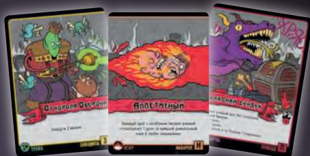
ЗАВОДИЛА + НАВОРОТ + ПРИХОД

Заметил ленту с названием карты? У выложенных рядом карт всех трёх типов получается общее название, состоящее из начала, середины и конца. Заводилы всегда кладутся в левую часть заклинания, навороты — в середину, а приходы замыкают заклинания справа.