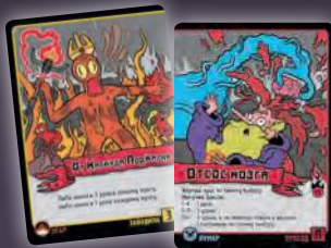
ЗАВОДИЛА + ПРИХОД