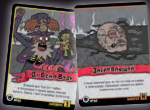
ЗАВОДИЛА + НАВОРОТ