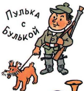
ПУЛКА С БУЛКОЙ