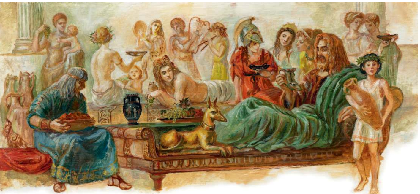
Пир на Олимпе

В пиршествах богов всегда присутствуют амброзия и нектар — пища и напиток богов. Их разносят богиня юности Геба и виночерпий Ганимед. Амброзия давала бессмертье и молодость, его создала богиня плодородия Деметра специально для олимпийских богов. Нектар — сладкий и благоухающий напиток красного цвета, также дающий бессмертье. Когда люди восклицают: «Это просто пища богов!» — имеют в виду, что пробуют блюдо или напиток прекрасного, изысканного вкуса, доступный немногим.