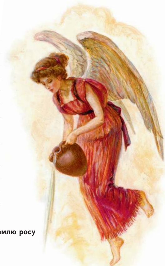
БОГИНЯ ЭОС льёт на землю росу

Великая гора Олимп — пристанище сонма богов. Над всеми царит Зевс — главный в древнегреческом пантеоне. Рядом его жена Гера, покровительница брака. Зевс утверждает порядок и законы на земле. Рядом с ними Аполлон, покровитель муз, и его сестра Артемида — богиня охоты, и золотоволосая Афродита, богиня красоты и любви, и любимая дочь Зевса — воительница Афина Паллада. Чертоги на Олимпе сделаны Гефестом, богом-кузнецом. У трона Зевса — богиня мира Эйрена и богиня победы Никэ. Здесь же богиня правосудия Фемида. Высоко над Олимпом раскинулось голубое бездонное небо, с него льётся золотой свет. Ни дождя, ни снега не бывает на Олимпе, здесь всё время благодатное лето. А ниже клубятся облака, закрывая землю.