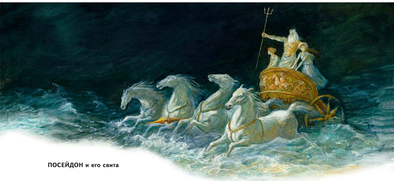
ПОСЕЙДОН и его свита

Посейдон — бог морей, у римлян — Нептун.