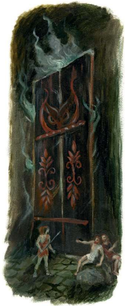
Двери в царство Аида

Великая Деметра вернула плодородие земле, и снова всё зацвело и зазеленело. Но каждый год покидает свою мать Персефона, и каждый раз Деметра погружается в печаль. И вся природа горюет по ушедшей, наступает зима. Спит природа, чтобы проснуться в радостном блеске весны тогда, когда вернётся к своей матери из безрадостного царства Аида её дочь. Тогда богиня плодородия щедрой рукой сыплет дары людям и благословляет труд земледельцев богатым урожаем.