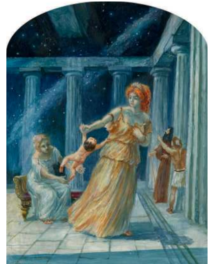
Гера и младенец Геракл

О происхождении Млечного Пути существовала такая легенда: после рождения героя Геракла от смертной женщины Зевс решил даровать ему бессмертье. Для этого он решил хитростью сделать так, чтобы богиня Гера накормила бы младенца своим молоком. Гера взяла дитя на руки, но увидев, что ребенок не её, разгневалась, отняла ребёнка от своей груди, а капли её молока брызнули на небо, создав молочную сверкающую полосу— Млечный Путь.