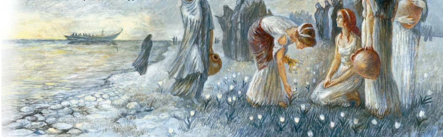
В ЦАРСТВЕ АИДА