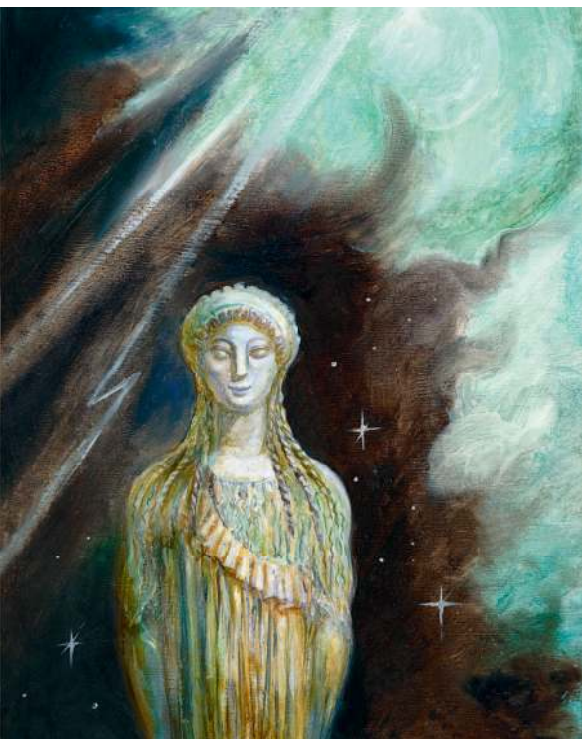
Из Хаоса возникли мир и бессмертные боги