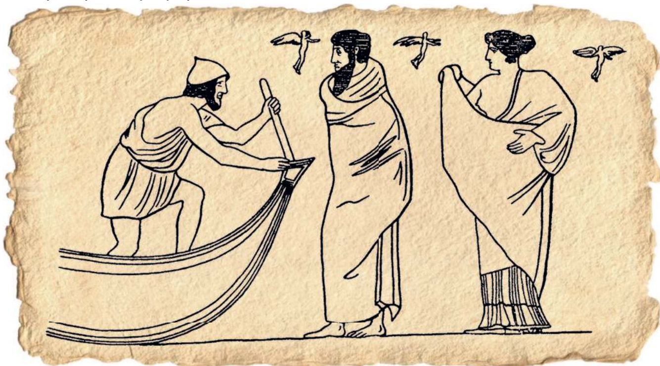
Харон перевозит души умерших

Глубоко под землёю царит Аид, брат Зевса, повелитель царства мёртвых. С поверхности земли ведут в это царство бездонные пропасти. По царству протекают подземные реки, главная из которых Стикс. По реке Ахеронт переправляет в царство Аида души умерших старец Харон. Но везёт он их только в одном направлении, и никому не удаётся вернуться обратно. У трона Аида — мрачный бог смерти Танат. Юный бог сна Гипнос вылетает из царства на землю и носится на своих крыльях с головками мака в руках — маковым молочком он смыкает веки смертных и погружает их в сладкий сон. Однако сон может стать смертельным, если Гипнос прольет молока больше, чем нужно. Здесь же боги и богини сновидений — и тяжёлых, мучительных, и лёгких, радостных или вещих, т. е. сбывающихся (по имени этого бога погружение в сон названо гипнозом). Стережёт вход в царство мёртвых ужасный пёс Кербер (Цербер). Под царством Аида находится мрачная бездна Тартар.