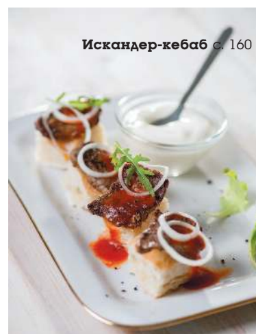
Искандер-кебаб с. 160