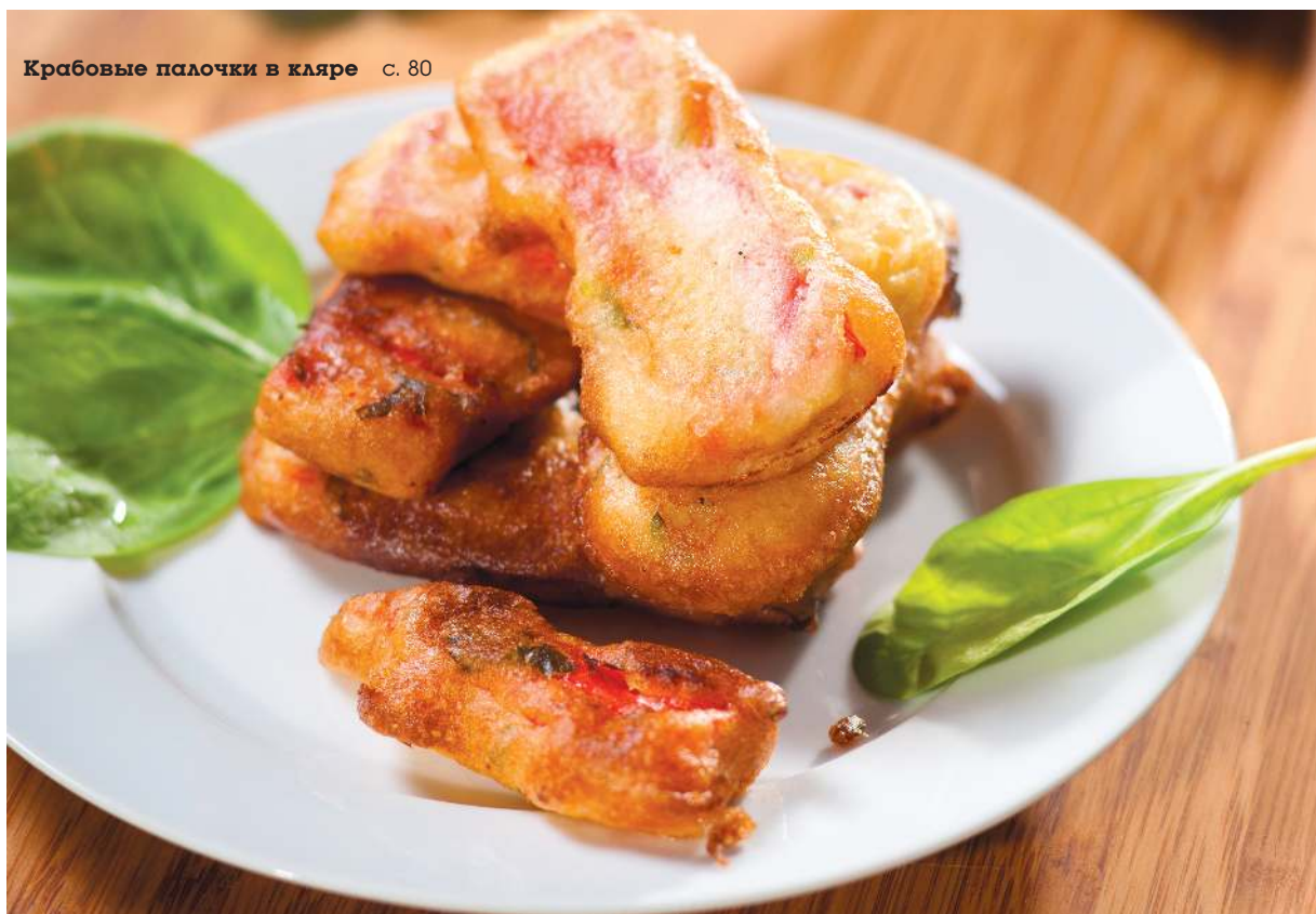
Крабовые палочки в кляре с. 80