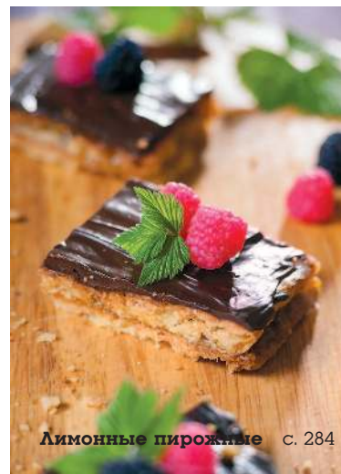
Лимонные пирожные с. 284