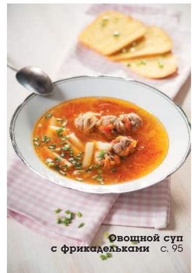
Овощной суп с фрикадельками с. 95