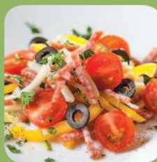
Салат с сүлгүни и салями