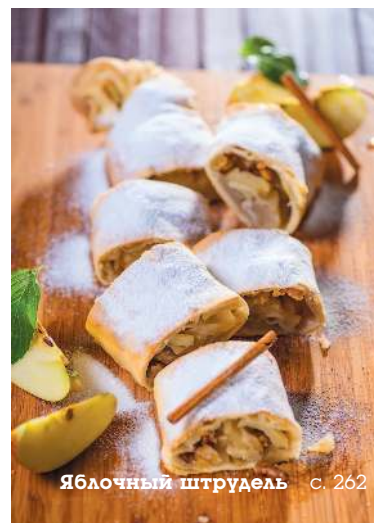
Яблочный штрудель с. 262