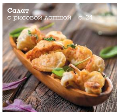
Салат с рисовой лапшой с. 24