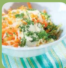
Салат «Коул слоу»