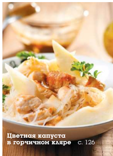
Цветная капуста в горчичном кляре с. 126