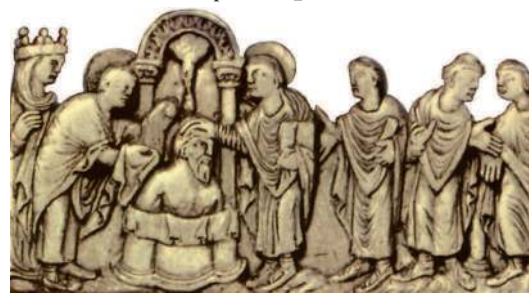
Крещение Хлодвиг. Украшение оклада Евангелия. IX в.

Германцы были язычниками и поклонялись своим древним богам, но уже в IV–V вв. остготы, вестготы, вандалы и бургунды приняли христианство арианского толка . Франки дольше других германцев придерживались веры отцов, но в 496 г. Хлодвиг крестился, причём стал не арианином , а ортодоксом , и получил поддержку ортодоксальной римской церкви и римско-галльской знати, что помогло расчётливому завоевателю утвердиться в Аквитании вместо ариан-вестготов. Совершив «крестовый поход» на еретиков-ариан, Хлодвиг прославился как «освободитель Галлии», и сам византийский император в 508 г. признал его власть над франками. Своей столицей Хлодвиг сделал галльский город Париж .