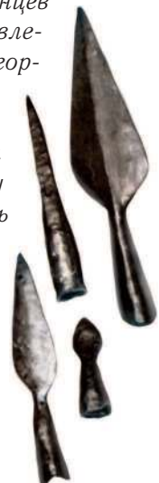
Наконечники копий и дротиков древних германцев

Германцы были прирождёнными воинами и жили войной. Свободный германец уже в 14 лет становился полноценным воином. У германцев были твёрдые представления о чести, они были горды, ценили храбрость и верность. Дружинников отличала личная преданность своему вождю, и они сражались за его славу, ибо успех вождя приносил процветание всему племени. Эти понятия о чести позднее вошли в рыцарский кодекс.