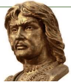
Аттила-вождь гуннов. Современная скульптура

В III–VII вв. из-за похолодания климата германские племена с севера двинулись к югу, вытесняя коренных обитателей. Началось Великое переселение народов. Волна варваров, усиленная давлением гуннов с Востока, накрыла Римскую империю и ускорила её крушение. На осколках западной части Империи германцы основали варварские королевства и, смешавшись с римлянами-латинянами и галлами (кельтами), стали основой для формирования западноевропейских народов.