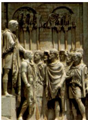
Пленные германцы перед императором. Барельеф с арки Константина в Риме. V в.

Когда Рим был силён, он держал варваров в узде, обращая их земли в свои провинции, вводя там свою культуру. Но когда Империя ослабла, варвары стали чаще совершать на неё набеги, и целью их была уже не добыча, как в былые времена, а возможность жить на землях Рима на правах римских граждан. Варвары заселяли римские провинции, и так проходила варваризация Империи. Римские императоры, не доверяя собственному народу, предпочитали набирать в армию варваров, не имевших связей в римском обществе. За службу варвары получали землю и римское гражданство. К концу III в. н.э. римская армия уже на \frac{3}{4} состояла из варваров. Дослужившись до высоких должностей, вожди варваров получали доступ к власти.