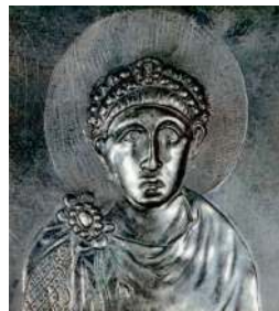
Император Феодосий. Рельеф V в.

Последний раз Империя объединилась при Феодосии Великом . После его смерти в 395 г. Империя была поделена между его сыновьями Аркадием и Гонорием и окончательно распалась на Западную и Восточную . Рим пришёл в упадок, и с 402 г. столицей Западной империи стал город Равенна. Власть над Западной империей захватили вожди варварских племен, управлявшие равеннскими императорами. В 476 г. командующий императорской гвардией германец Одоакр низложил в Равенне последнего римского императора Ромула и образовал в Италии своё королевство. Этот год принято считать концом истории Древнего мира и началом нового исторического периода – Средних веков. На обломках Империи образовались королевства варваров , и в них складывались новые феодальные общественно-экономические отношения .