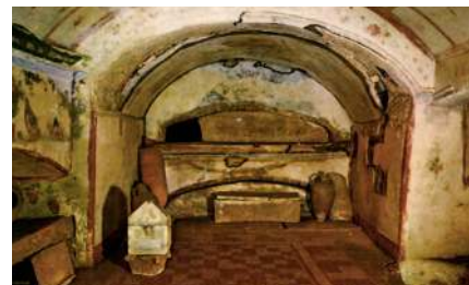
Крипта (подземное убежище) в катакомбах Святого Себастьяна в Риме