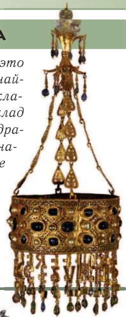
Вотивная корона. Церковное подношение вестготского короля. VII в.

Вестготы были умелыми ювелирами, это видно по великолепным украшениям, найденным в вестготских захоронениях и кладках. В XIX в. под Толедо был найден клад с 11 золотыми коронами, украшенными драгоценными камнями. Эти короны предназначались не для ношения, а в качестве королевских даров церкви и назывались вотивными, т.е. посвящёнными богу. Короны на цепях подвешивали как украшение над алтарём.