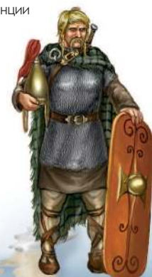
Кельты, населявшие западные провинции Рима

Земли кельтов ( галлов ) вошли в состав Империи, как провинции Галлия (нынешняя Франция) и Британия (нынешняя Англия), где жило кельтское племя бриттов . В Европе, севернее римских владений, от Северного до Чёрного морей, раскинулись земли германских племён : англов, ютов, тевтонов, саксов, лангобардов, вандалов, алеманнов, франков, готов и др.