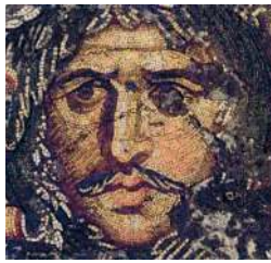
Готский вождь. Мозаика из дворца в Константинополе. VI в.

Вестготы (западные готы) в 376 г. под натиском гуннов переселились из Причерноморья в римскую Фракию , где подняли мятеж против притеснявших их римлян. Замиривший вестготов Феодосий Великий нанимал их в римскую армию. Но провозглашённый в начале 390-х гг. вестготским королём Аларих I обратил свои войска против Империи и захватил Грецию и Италию. В 410 г., разорив Рим , Аларих внезапно умер. Его наследники примирились с римлянами, и за помощь в очищении Пиренейского п-ова от вандалов получили для поселения Аквитанию , область на юго-западе Галлии (на территории нынешней Франции). Там вестготы основали Тулузское королевство , к концу V в. присоединив к нему большую часть Пиренейского п-ова (территорию нынешних Испании и Португалии). Для отражения нашествия Аттилы вестготы снова объединились с римлянами и сражались против гуннов и остготов на Каталонских полях.