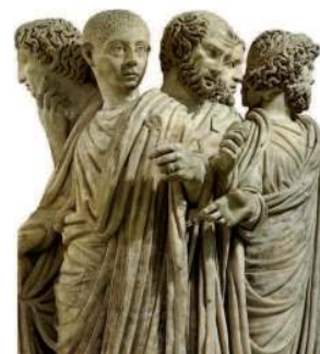
Римляне. Деталь саркофага. III в.

Первые упоминания о рыцарях относятся к концу X в. Но истоки рыцарства надо искать на несколько столетий раньше, на обломках Римской империи, где образовывались новые народы и государства. Рыцарство складывалось на основе новых форм социальных отношений, установившихся в этих странах, под эгидой христианской веры, объединившей новые народы.