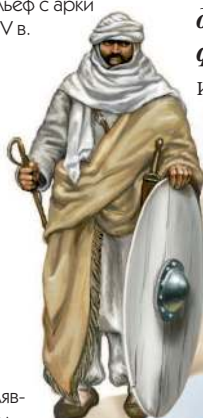
Мавры – арабы, населявшие Северную Африку