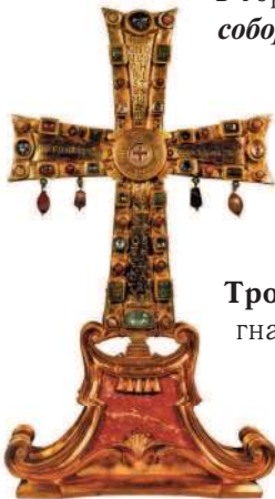
Христианский крест. Рим. VI в.

Троицы – Бога-Отца, Бога-Сына и Святого Духа. Ария отправили в изгнание, его учение осудили. Центром ортодоксов стал Рим .