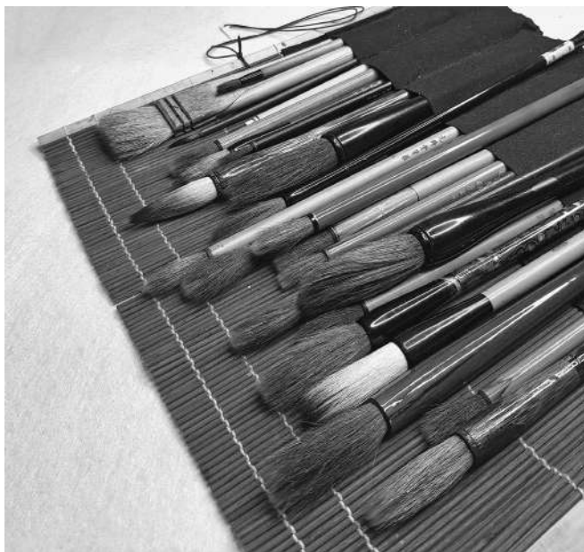
Бамбуковый пенал с кистями для тушевой живописи

У каждого изготовителя кистей свой стандарт размеров и нет номера, как принято у европейских производителей. В онлайн-магазинах обычно указывается толщина и длина волосков кисти. В продаже есть большой выбор кистей китайского производства. Они хорошего качества и более доступны по цене, чем японские. Лучшая рекомендация в выборе кисти — отзывы более опытных художников.