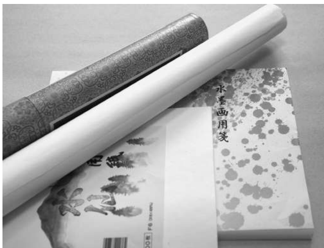
Бумага для суми-э в пачках и рулонах

Японская бумага под названием «Слива» и «Нарцисс» лучше всего подойдет для начинающих рисовать. Бумагу китайского производства трудно выбрать по названию. Качество бумаги одного и того же наименования может отличаться. Поэтому нужно взять на пробу несколько разных листов и затем купить ту, которая понравилась больше.