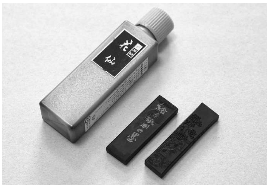
Жидкая тушь в банке и сухая в бруске

Выбирая тушь, консультируйтесь с продавцом. Обычно есть выбор качественной жидкой туши для живописи по недорогой цене. Тушь в бруске лучше купить подороже, она будет хорошо растираться и не испортит камень, а вы сможете получить удовольствие от процесса.