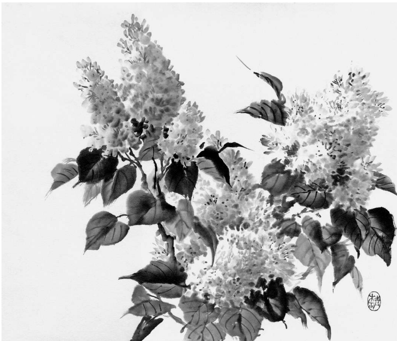
Цветы сирени, 2015, бумага, тушь, 38×46 см