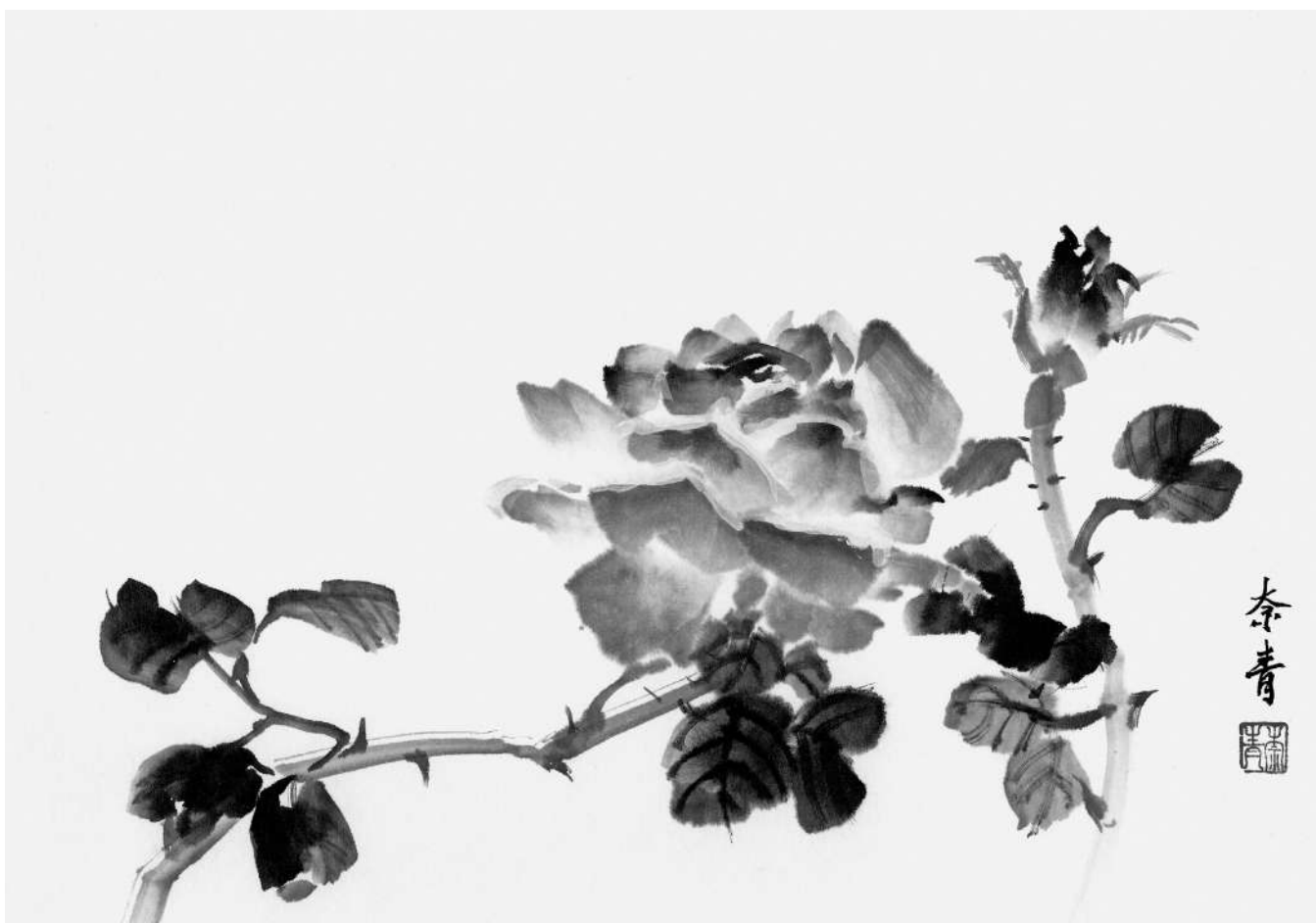
Розы, 2023, бумага, тушь, 25 × 34 см