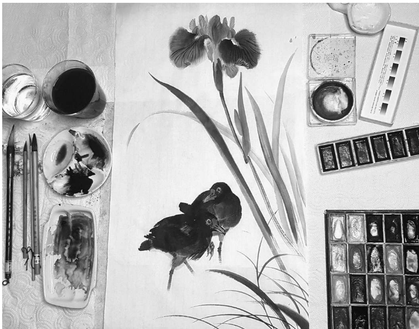
Рабочее место художника

От правильного выбора материалов будет зависеть ваше впечатление от первых занятий и решение — продолжать или нет.