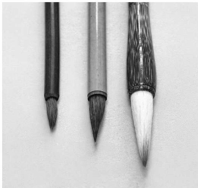
Хорошая кисть — главная вещь на начальном этапе обучения. Начинающим достаточно будет иметь три кисти: со смешанным ворсом толщиной с указательный палец у основания волосков, с коричневым ворсом толщиной с мизинец и тонкую толщиной 3–5 мм, длиной 1,5–2 см.