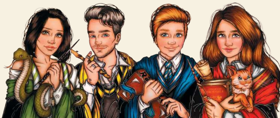
Работа, выполненная в описанной смешанной акварельной технике

И, так как любовь к рисованию была со мной с самого детства, я испробовала все доступные мне арт-материалы: гуашь, пастель, карандаши, масло, но самой большой моей любовью стала акварель, которую я долгое время и использовала в качестве основного материала для моих работ. Работала я в смешанной акварельной технике, где на восемьдесят процентов работа выполнялась акварелью, а оставшиеся двадцать – карандашами, линерами и другими материалами, но не спиртовыми маркерами.