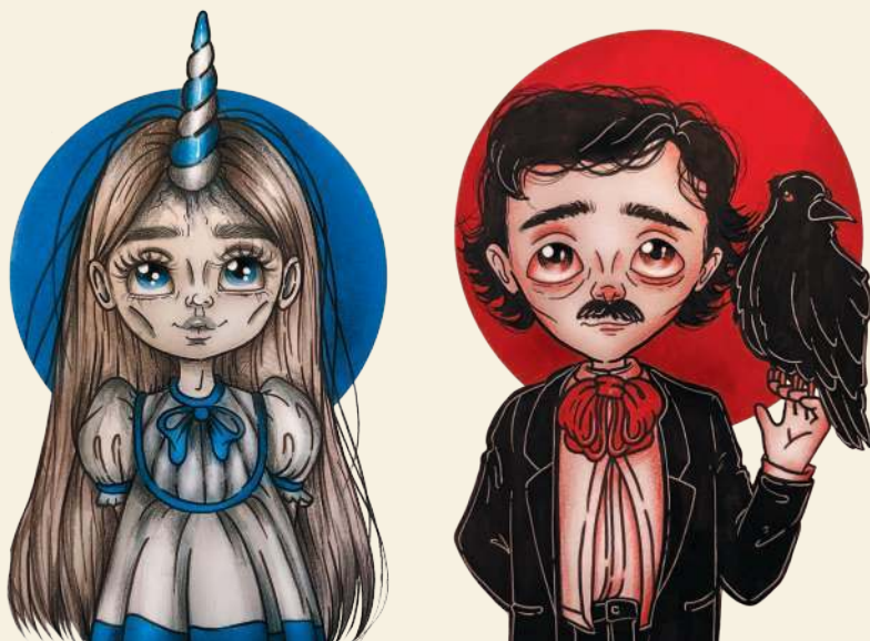
Рисунки, выполненные двумя оттенками спиртовых маркеров

Можно начать работать и с очень ограниченной цветовой палитрой, с использованием трех-четырех цветов или даже двух, как показано на рисунках ниже.