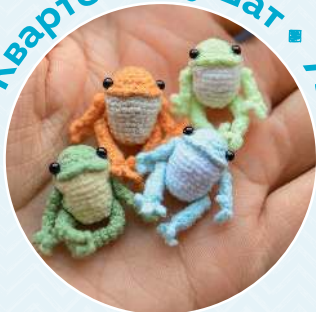
Квартет лягушат ■ 73