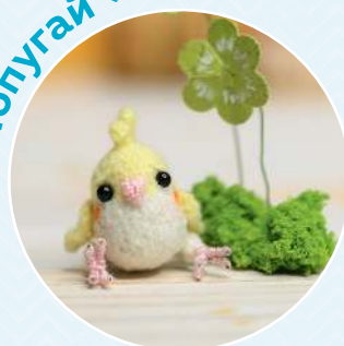
Попугай ■ 87