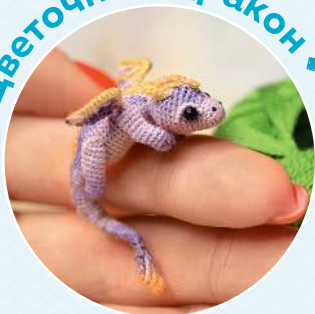
Цветочный дракон ■ 105