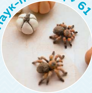
Паук-птицеед ■ 61