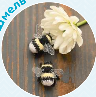
Шмель ■ 47