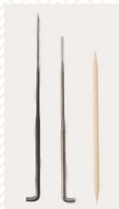
Иглы для валяния, зубочистка