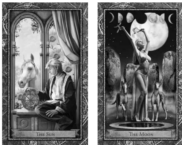
Солнце в Рыбах

Какая карта из Старших Арканов соответствует вашему знаку Солнца? Как две карты — Солнце и его знак — дополняют или отрицают друг друга? Как они описывают вашу личность, индивидуальность и самовосприятие? Что вы можете узнать из своего первого расклада по Таро и астрологии?