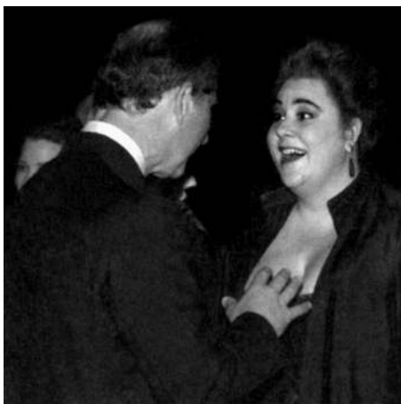
Принц Чарльз нашел пикантную собеседницу

ствам, которые человек испытывает в данный момент. Например, мужчина, осознающий, что начинает полнеть, может в минуту задумчивости пальцами крутить складку под подбородком. Женщина, понимающая, что у нее слишком полные бедра, будет бессознательно одергивать юбку и тянуть ее вниз. Человек, испытывающий страх или занимающий оборонительную позицию, скрещивает руки или ноги. Мужчина, разговаривающий с пышногрудой собеседницей, сознательно старается не смотреть на ее грудь, однако в то же время неосознанно совершает ощупывающие жесты руками.