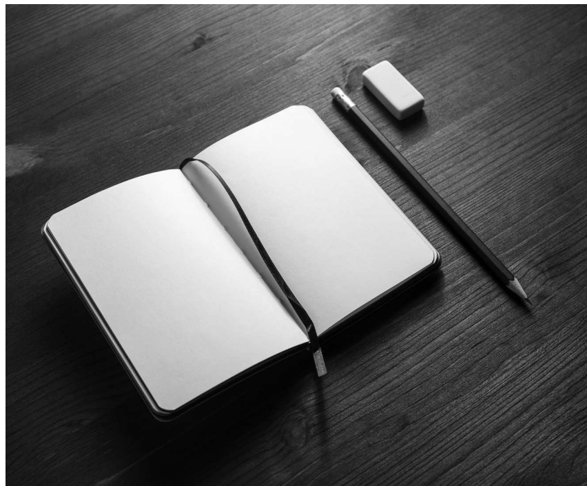
Основные инструменты и материалы для карандашного скетчинга

Бумага в скетчбуке не должна быть слишком шершавой или, напротив, слишком гладкой. При этом качество бумаги, например, для рисунков карандашом и для акварели может немного различаться. Если вы пока не очень хорошо разбираетесь в материалах – обратитесь за помощью к продавцу и скажите, что вам нужен альбом для карандашного скетчинга.