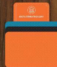
Карты событий, кризисов и опций