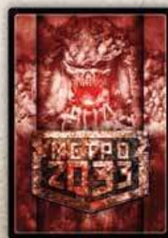
Угрозы второго этапа