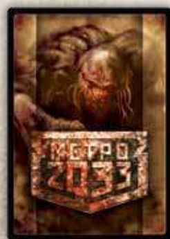
Угрозы первого этапа