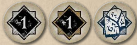
44 жетона хаоса

Примеры игровых компонентов представлены здесь для ознакомления. Полный разбор карт ищите на стр. 28–31 справочника.