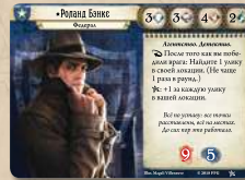
5 карт сыщиков