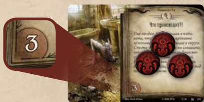
В игре 3 жетона безысходности. Таким образом, замысел продвигается.