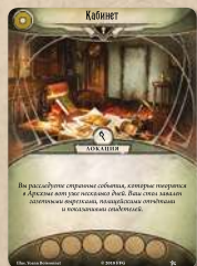
карта локации (двусторонняя)