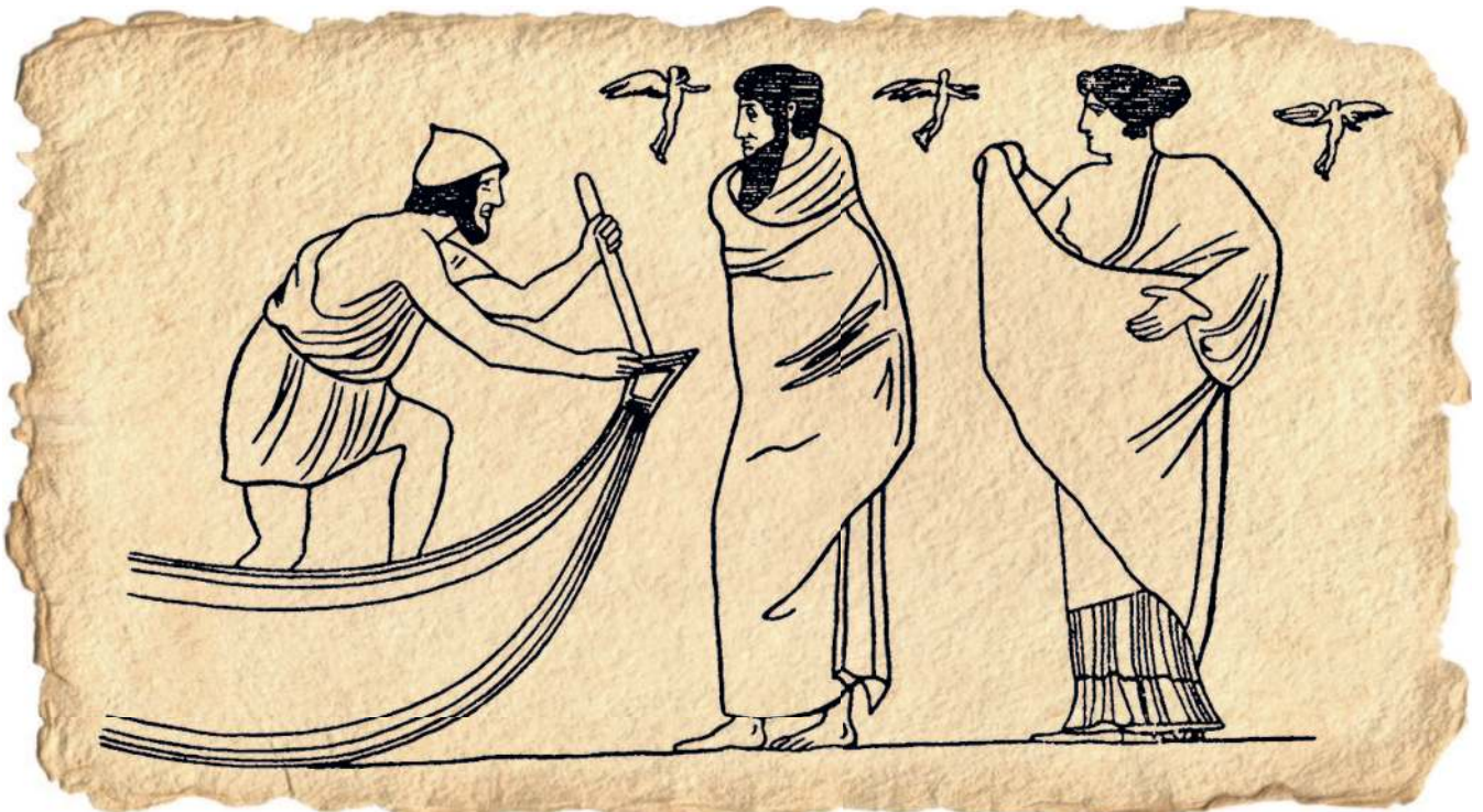
Харон перевозит души умерших

Глубоко под землёю царит Аид, брат Зевса, повелитель царства мёртвых. С поверхности земли ведут в это царство бездонные пропасти. По царству протекают подземные реки, главная из которых Стикс. По реке Ахеронт переправляет в царство Аида души умерших старец Харон. Но везёт он их только в одном направлении, и никому не удаётся вернуться обратно. У трона Аида — мрачный бог смерти Танат. Юный бог сна Гипнос вылетает из царства на землю и носится на своих крыльях с головками мака в руках — маковым молочком он смыкает веки смертных и погружает их в сладкий сон. Однако сон может стать смертельным, если Гипнос прольет молока больше, чем нужно. Здесь же боги и богини сновидений — и тяжёлых, мучительных, и лёгких, радостных или вещих, т. е. сбывающихся (по имени этого бога погружение в сон названо гипнозом). Стережёт вход в царство мёртвых ужасный пёс Кербер (Цербер). Под царством Аида находится мрачная бездна Тартар.