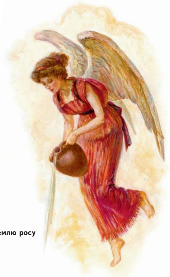
БОГИНЯ ЭОС льёт на землю росу

Великая гора Олимп — пристанище сонма богов. Над всеми царит Зевс — главный в древнегреческом пантеоне. Рядом его жена Гера, покровительница брака. Зевс утверждает порядок и законы на земле. Рядом с ними Аполлон, покровитель муз, и его сестра Артемида — богиня охоты, и золотоволосая Афродита, богиня красоты и любви, и любимая дочь Зевса — воительница Афина Паллада. Чертоги на Олимпе сделаны Гефестом, богом-кузнецом. У трона Зевса — богиня мира Эйрена и богиня победы Никэ. Здесь же богиня правосудия Фемида. Высоко над Олимпом раскинулось голубое бездонное небо, с него льётся золотой свет. Ни дождя, ни снега не бывает на Олимпе, здесь всё время благодатное лето. А ниже клубятся облака, закрывая землю.