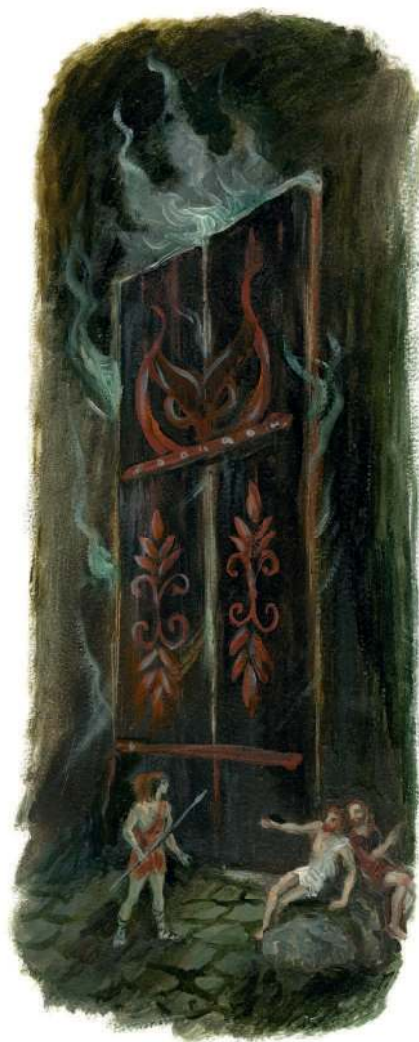
Двери в царство Аида

Великая Деметра вернула плодородие земле, и снова всё зацвело и зазеленело. Но каждый год покидает свою мать Персефона, и каждый раз Деметра погружается в печаль. И вся природа горюет по ушедшей, наступает зима. Спит природа, чтобы проснуться в радостном блеске весны тогда, когда вернётся к своей матери из безрадостного царства Аида её дочь. Тогда богиня плодородия щедрой рукой сыплет дары людям и благословляет труд земледельцев богатым урожаем.