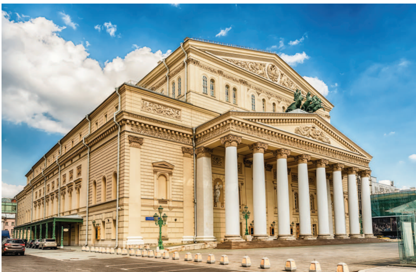
Большой театр, арх. Осип Бове, Москва, 1825