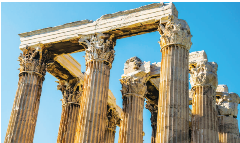
Колонны Храма Зевса Олимпийского, Афины, II в. до н.э. — II в. н.э.