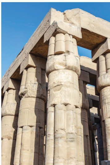
Папирусовидная колонна в Луксорском храме, Египет, XIV в. до н. э.