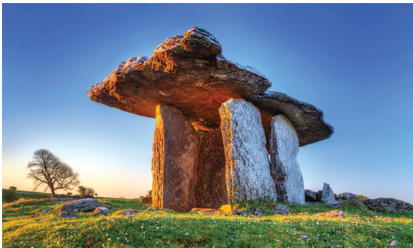
Дольмен Пулнаброн, Ирландия, 4200 до 2900 гг. до н. э.