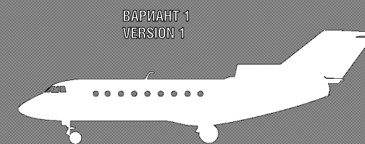
ВАРИАНТ 1 VERSION 1