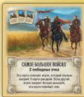
Самое большое войско