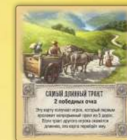
Самый длинный тракт