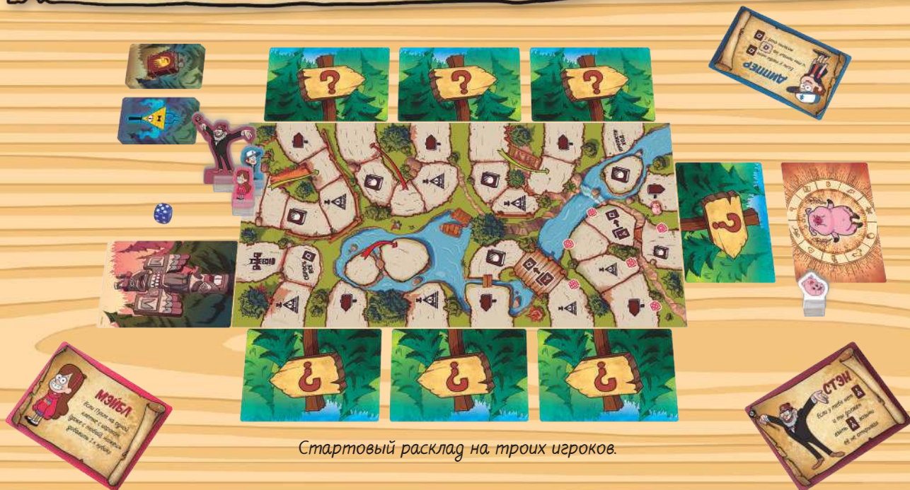
Стартовый расклад на троих игроков.