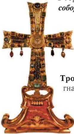
Христианский крест. Рим. VI в.

Троицы – Бога-Отца, Бога-Сына и Святого Духа. Ария отправили в изгнание, его учение осудили. Центром ортодоксов стал Рим .