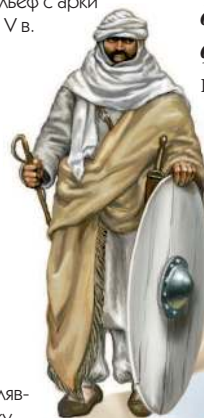
Мавры – арабы, населявшие Северную Африку