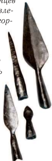
Наконечники копий и дротиков древних германцев

Германцы были прирождёнными воинами и жили войной. Свободный германец уже в 14 лет становился полноценным воином. У германцев были твёрдые представления о чести, они были горды, ценили храбрость и верность. Дружинников отличала личная преданность своему вождю, и они сражались за его славу, ибо успех вождя приносил процветание всему племени. Эти понятия о чести позднее вошли в рыцарский кодекс.