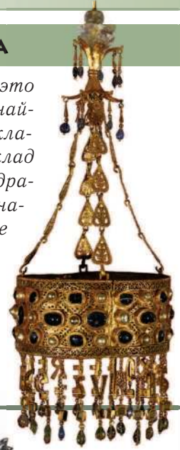
Вотивная корона. Церковное подношение вестготского короля. VII в.

Вестготы были умелыми ювелирами, это видно по великолепным украшениям, найденным в вестготских захоронениях и кладках. В XIX в. под Толедо был найден клад с 11 золотыми коронами, украшенными драгоценными камнями. Эти короны предназначались не для ношения, а в качестве королевских даров церкви и назывались вотивными, т.е. посвящёнными богу. Короны на цепях подвешивали как украшение над алтарём.