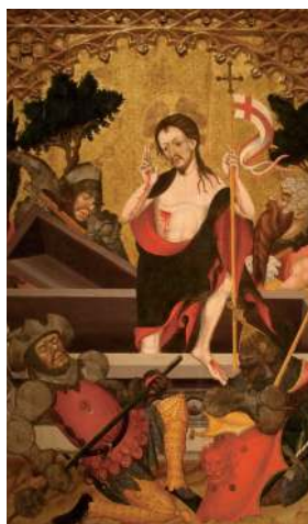
Воскресение Христа. Фрагмент алтарной иконы 1407–1411 гг. Каталония

Под воздействием христианства выработался нравственный идеал рыцаря. Христианская вера обязывала рыцаря придерживаться клятвы, данной своему сеньору, помогать слабым, бороться с несправедливостью. Она сплотила рыцарство разных государств в международное военное братство и повела его в крестовые походы.