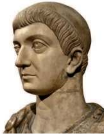
Император Константин. Скульптура IV в.

В конце III в. н.э. император Диоклетиан для удобства управления разделил страну на четыре части – префектуры – две западные и две восточные. При его преемниках этот раздел перешёл в раскол – образовались Западная и Восточная Римские империи . Император Константин Великий , объединивший осаждаемый варварами запад и более спокойный восток, в 330 г. перенёс столицу империи на восток, в город Византий , который нарекли его именем – Константинополь . Но после смерти Константина Римская империя вновь распалась на две части – Западную, со столицей в Риме, и Восточную, со столицей в Константинополе. На востоке власть императоров была сильна, и Восточная Римская империя, известная в истории как Византия , просуществовала ещё почти тысячу лет. Западная Римская империя, раздираемая внутренними распрями и набегами варваров, клонилась к закату.