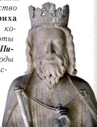
Хлодвиг I. Фрагмент надгробия в аббатстве Сен-Дени. Париж

Хлодвиг I (ок. 466–511 гг.), внук Меровея, унаследовал власть над небольшим королевством салических франков примерно в 481 г., когда ему было всего 15 лет. В 486 г. Хлодвиг, разбив войска Сиагирия , римского наместника в Галлии, завоевал Нейстрию – последний оплот римлян в Галлии. Затем он захватил земли осевших в Галлии алеманнов . В союзе с бургундами Хлодвиг, женившийся на дочери бургундского короля Клотильде , в 507 г. выступил в поход на завоевание вестготского Тулузского королевства . Он разгромил их в сражении при Вуйе , убив в поединке вестготского короля. Аквитания – галльское владение вестготов – перешла франкам. Лишь вмешательство остготского короля Теодориха Великого спасло вестготское королевство от развала: вестготы сохранили за собой земли на Пиренейском п-ове . В последние годы жизни коварный Хлодвиг расправился со своими родичами, королями рипуанских франков , объединив под своей властью все земли франков. Так возникло Франкское государство , и Хлодвиг вошёл в историю как его основатель.