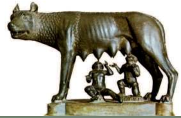
Легендарные Ромул и Рем – основатели Рима, вскормленные волчицей. Скульптура V в. до н.э.

Рим – столица Римской империи, был основан в 753 г. до н.э. легендарным Ромулом . История Древнего Рима прошла от «Ромула до Ромула» – последнего императора Западной Римской империи, которого низложили в г. Равенне , по иронии судьбы также звали Ромулом. Знаки императорского достоинства были отосланы в Константинополь, который стал преемником величия «Вечного города» – Вторым Римом . С падением в 1453 г. Византии преемницей её славы и наследницей древней православной культуры стала Москва – Третий Рим .