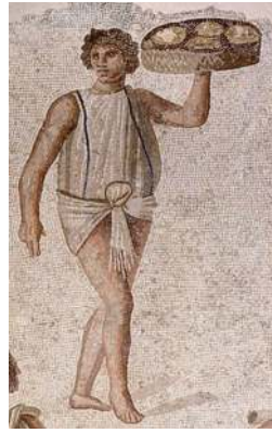
Раб. Римская мозаика. II в.

В римском поместье велось натуральное хозяйство , т.е. поместье само обеспечивало себя необходимыми продуктами и сырьём. В поместье выращивали хлеб, овощи, виноград на вино, оливы на масло, лён на ткани, разводили скот, дававший молоко, мясо, шерсть и кожи, охотились, занимались ремёслами. Колоны кормили и одевали себя и своего патрона. Так поместье стало независимым хозяйственным центром, а власть магната в поместье заменила и местную, и государственную власть. Для защиты своих владений и людей магнат набирал из колонов вооружённые отряды. Эта военная обслуга кормилась у своего патрона и повиновалась ему. Так появились воины, служившие не государству, а частному лицу, от которого они зависели.