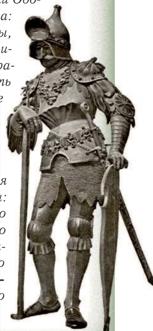
Теодорих Великий. Бронзовая скульптура. 1514 г.

Теодорих Великий (ок. 454–526 гг.), король остготов с 493 г., в детстве был заложником в Константинополе , впитал греко-римскую культуру и принял христианство арианского толка. С правившим в Италии Одоакром у Теодориха была давняя вражда: отец Одоакра, германец из свиты Аттилы, был убит отцом Теодориха. Теодорих принял предложение византийского императора Зенона завоевать Италию и убить Одоакра. Создав в Италии остготское королевство, Теодорих признал себя наместником императора. На деле он правил самостоятельно, хотя и стремился сблизить готы и римлян, утвердив в королевстве римское право. Он породнился с влиятельными германскими королями: король франков Хлодвиг выдал за него свою дочь, сестра Теодориха стала женою короля вандалов , а его дочери вышли замуж за короля вестготов и бургундского королевича . Теодорих умер в 526 г. в Равенне , и его королевство ненадолго пережило первого короля.