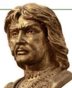
Аттила-вождь гуннов. Современная скульптура

В III–VII вв. из-за похолодания климата германские племена с севера двинулись к югу, вытесняя коренных обитателей. Началось Великое переселение народов. Волна варваров, усиленная давлением гуннов с Востока, накрыла Римскую империю и ускорила её крушение. На осколках западной части Империи германцы основали варварские королевства и, смешавшись с римлянами-латинянами и галлами (кельтами), стали основой для формирования западноевропейских народов.