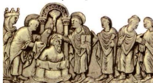
Крещение Хлодвиг. Украшение оклада Евангелия. IX в.

Германцы были язычниками и поклонялись своим древним богам, но уже в IV–V вв. остготы, вестготы, вандалы и бургунды приняли христианство арианского толка . Франки дольше других германцев придерживались веры отцов, но в 496 г. Хлодвиг крестился, причём стал не арианином , а ортодоксом , и получил поддержку ортодоксальной римской церкви и римско-галльской знати, что помогло расчётливому завоевателю утвердиться в Аквитании вместо ариан-вестготов. Совершив «крестовый поход» на еретиков-ариан, Хлодвиг прославился как «освободитель Галлии», и сам византийский император в 508 г. признал его власть над франками. Своей столицей Хлодвиг сделал галльский город Париж .