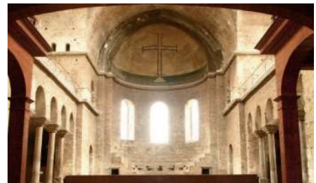
Церковь Св. Ирины в Константинополе (Стамбуле). По одному из преданий, здесь крестился император Константин. Крест – мозаика VIII в.

Римский император Константин , видевший в христианстве идею, способную объединить империю, решил преодолеть раскол, и в 325 г. в городе Никее созвал Никейский собор . На этом собрании победили сторонники ортодоксального учения ( ортодоксы ) и был принят символ веры – основные церковные положения, утверждавшие единство и равенство Святой