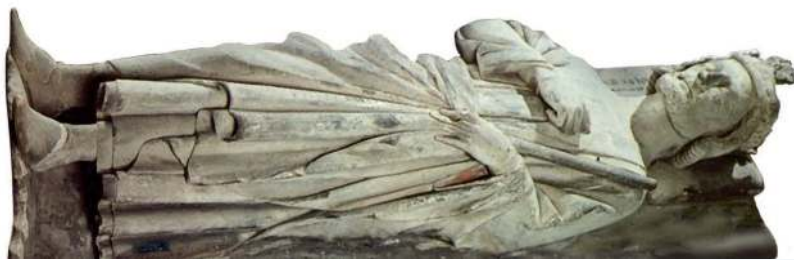
Надгробие Карла Мартелла в аббатстве Сен-Дени. Париж

По германской традиции, после смерти короля все его сыновья получали свою долю наследства, так как королевство считалось личным имуществом предыдущего правителя. После смерти Хлодвига его королевство было поделено между его сыновьями, которые продолжили завоевания, в 530-е гг. отняв у вестготов южные области Галлии – Гасконь и Септиманию , на севере присоединив часть владений германских племён тюрингов и захватив Бургундию и Прованс на востоке. Но междоусобицы наследников Хлодвига нарушили единство франкского государства, оно распалось на ряд полунезависимых королевств. Власть Меровингов ослабла, последние представители этой династии вошли в историю как «ленивые короли». За них правили управляющие их королевскими дворами – мажордомы , выбранные из влиятельных родов франкской аристократии.