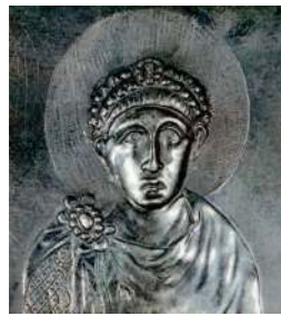
Император Феодосий. Рельеф V в.

Последний раз Империя объединилась при Феодосии Великом . После его смерти в 395 г. Империя была поделена между его сыновьями Аркадием и Гонорием и окончательно распалась на Западную и Восточную . Рим пришёл в упадок, и с 402 г. столицей Западной империи стал город Равенна. Власть над Западной империей захватили вожди варварских племен, управлявшие равеннскими императорами. В 476 г. командующий императорской гвардией германец Одоакр низложил в Равенне последнего римского императора Ромула и образовал в Италии своё королевство. Этот год принято считать концом истории Древнего мира и началом нового исторического периода – Средних веков. На обломках Империи образовались королевства варваров , и в них складывались новые феодальные общественно-экономические отношения .