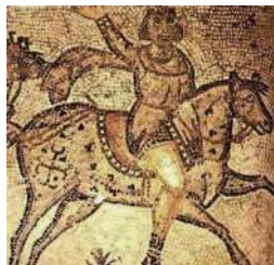
Воин-германец. Римская мозаика V в.

В военном деле возросла роль конницы, и магнаты, как позднее и варварские короли, нуждались в хорошо вооружённом конном войске. Кони и оружие стоили дорого. Чтобы воин смог вооружиться, патрон наделял его бенефицием – земельным владением с крестьянами, дававшим ему средства. Бенефиций оставался в собственности получателя, пока тот служил своему патрону. Позднее бенефиций стал передаваться по наследству и получил название феод . Магнат, предоставивший феод, становился сеньором или сюзереном , тот, кто получал феод – его вассалом . Землевладельцы (вассалы и сеньоры) сформировали класс феодалов . Сложился новый общественный строй – феодализм , а из вассалов впоследствии сформировалось рыцарское сословие .