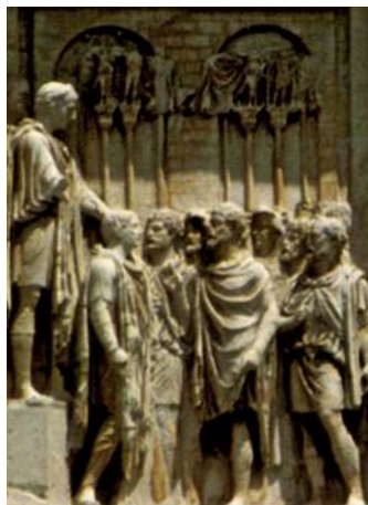
Пленные германцы перед императором. Барельеф с арки Константина в Риме. V в.

Когда Рим был силён, он держал варваров в узде, обращая их земли в свои провинции, вводя там свою культуру. Но когда Империя ослабла, варвары стали чаще совершать на неё набеги, и целью их была уже не добыча, как в былые времена, а возможность жить на землях Рима на правах римских граждан. Варвары заселяли римские провинции, и так проходила варваризация Империи. Римские императоры, не доверяя собственному народу, предпочитали набирать в армию варваров, не имевших связей в римском обществе. За службу варвары получали землю и римское гражданство. К концу III в. н.э. римская армия уже на \frac{3}{4} состояла из варваров. Дослужившись до высоких должностей, вожди варваров получали доступ к власти.