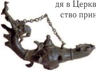
Светильник в виде грифона с символом Христа. Грифон символизирует Христа, голубь на его голове – Святого Духа. III–IV вв.