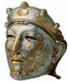
Шлем-маска римского всадника. I в.

Прообразом рыцарского сословия – братства конных воинов – в Древнем Риме может считаться сословие всадников , которое изначально представляло собой сражавшуюся верхом римскую знать. С точки зрения вооружения и применения на поле боя, прототипом рыцаря являлся клибанарий – тяжеловооружённый конный воин поздней Римской империи. Другими предшественниками рыцарей стали дружинники варварских вождей, единственным занятием которых была война, а целью – слава и добыча.