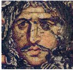
Готский вождь. Мозаика из дворца в Константинополе. VI в.

Вестготы (западные готы) в 376 г. под натиском гуннов переселились из Причерноморья в римскую Фракию , где подняли мятеж против притеснявших их римлян. Замиривший вестготов Феодосий Великий нанимал их в римскую армию. Но провозглашённый в начале 390-х гг. вестготским королём Аларих I обратил свои войска против Империи и захватил Грецию и Италию. В 410 г., разорив Рим , Аларих внезапно умер. Его наследники примирились с римлянами, и за помощь в очищении Пиренейского п-ова от вандалов получили для поселения Аквитанию , область на юго-западе Галлии (на территории нынешней Франции). Там вестготы основали Тулузское королевство , к концу V в. присоединив к нему большую часть Пиренейского п-ова (территорию нынешних Испании и Португалии). Для отражения нашествия Аттилы вестготы снова объединились с римлянами и сражались против гуннов и остготов на Каталонских полях.