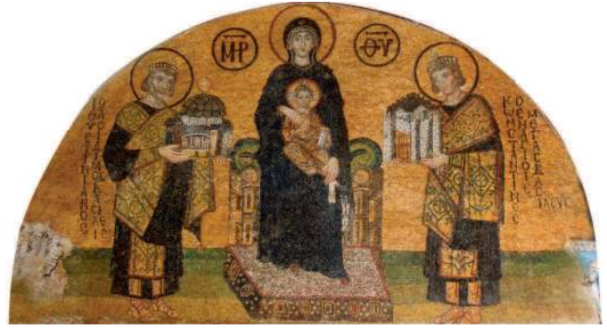
Император Юстиниан подносит Богородице собор Св. Софии, а император Константин – град Константинополь. Мозаика собора Св. Софии в Константинополе (Стамбуле). X в.

Римский император Константин Великий , оценив силу церковной организации христиан, решил обратиться её себе на пользу. В 313 г. он признал равенство христианства с остальными религиями и получил поддержку Церкви , а в конце жизни и сам принял христианство. При императоре Феодосии Великом в 380 г. христианство стало государственной религией и заменило язычество. Главным христианским храмом Феодосий сделал Софийский собор в Константинополе (ныне Стамбуле ). Позднее, найдя в Церкви опору своей власти, христианство приняли варварские короли .