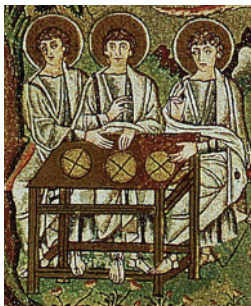
Святая Троица. Мозаика из храма Сан-Витале. Равенна. XI в.