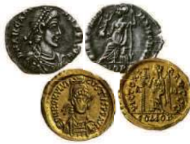
Римские монеты. V в.