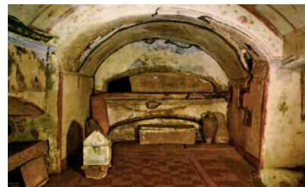
Крипта (подземное убежище) в катакомбах Святого Себастьяна в Риме