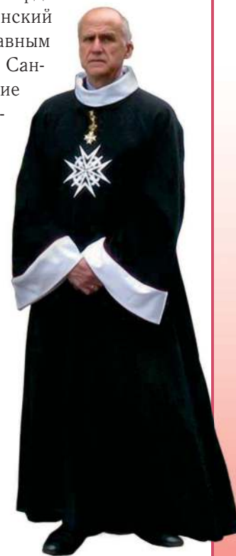
Современный рыцарь Мальтийского ордена.

Рыцарство возникало постепенно, выделяясь из общей массы воинов, и точной даты начала «рыцарского периода» не существует. Принято считать, что как сословие рыцарство сформировалось в X в. Исчезло рыцарство также постепенно, теряя военное значение и сливаясь с дворянством. Концом «рыцарской эпохи» считают XVI в. Исчезла рыцарская конница, но не рыцари: посвящение в рыцари осталось одной из самых престижных наград. И поныне в Англии, Испании, Швеции, Дании, Австрии и ряде других стран существуют рыцарские ордены. Некоторые из них действуют как гуманитарные организации, например, Мальтийский и Тевтонский ордены. Во главе ордена Подвязки и ордена Бани стоит королева Англии, испанский король возглавляет орден Золотого Руна, испанский принц является главным командором ордена Сантьяго. Эти и другие старейшие монархические ордены состоят из постоянно-го числа рыцарей (всего несколько десятков). В наше время рыцарство получают и женщины: они становятся дамами ордена. Посвящение в рыцарство продолжает служить публичным признанием заслуг.