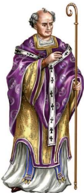
Священник Римской церкви

Епископы – так назывались старосты христианских общин – собирались на съезды – соборы для обсуждения вопросов веры и организации церкви. На Никейском соборе была утверждена церковная иерархия (порядок), и во главе Церкви стали патриархи . Главный, римский патриарх получил почётное звание Римского Папы . С разделом Империи на Западную и Восточную, главой восточной Церкви стал константинопольский патриарх . Со временем различия традиций восточной и западной Церквей привели к расколу христианской Церкви, официально утверждённому в 1054 г. в соборе Святой Софии в Константинополе. Возникли западная Римско-католическая церковь с центром в Риме и восточная – православная церковь с центром в Константинополе .