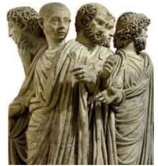
Римляне. Деталь саркофага. III в.

Первые упоминания о рыцарях относятся к концу X в. Но истоки рыцарства надо искать на несколько столетий раньше, на обломках Римской империи, где образовывались новые народы и государства. Рыцарство складывалось на основе новых форм социальных отношений, установившихся в этих странах, под эгидой христианской веры, объединившей новые народы.