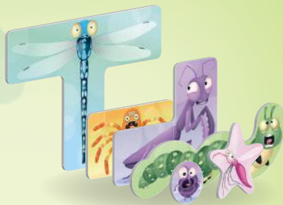
30 жетонов насекомых (по шесть пяти цветов)