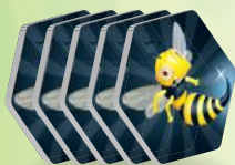
5 жетонов ос