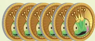
30 жетонов вкусняшек