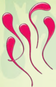
8 липких языков (включая 2 запасных)