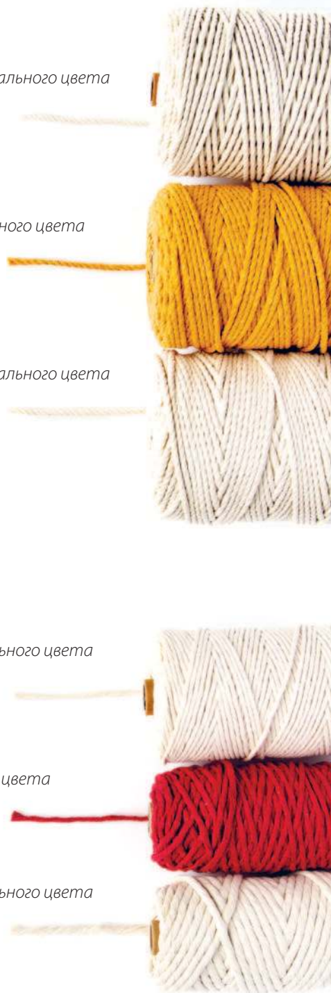
нить 7 мм натурального цвета