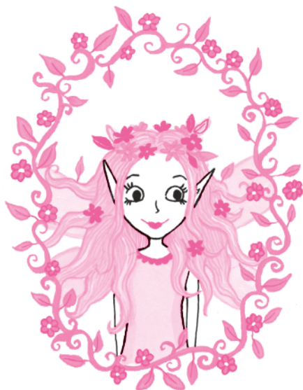
Мама Графиня Корделия Мун