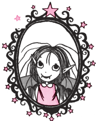
Я! Изадора Мун