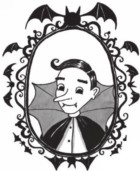
Папа Граф Бартоломью Мун