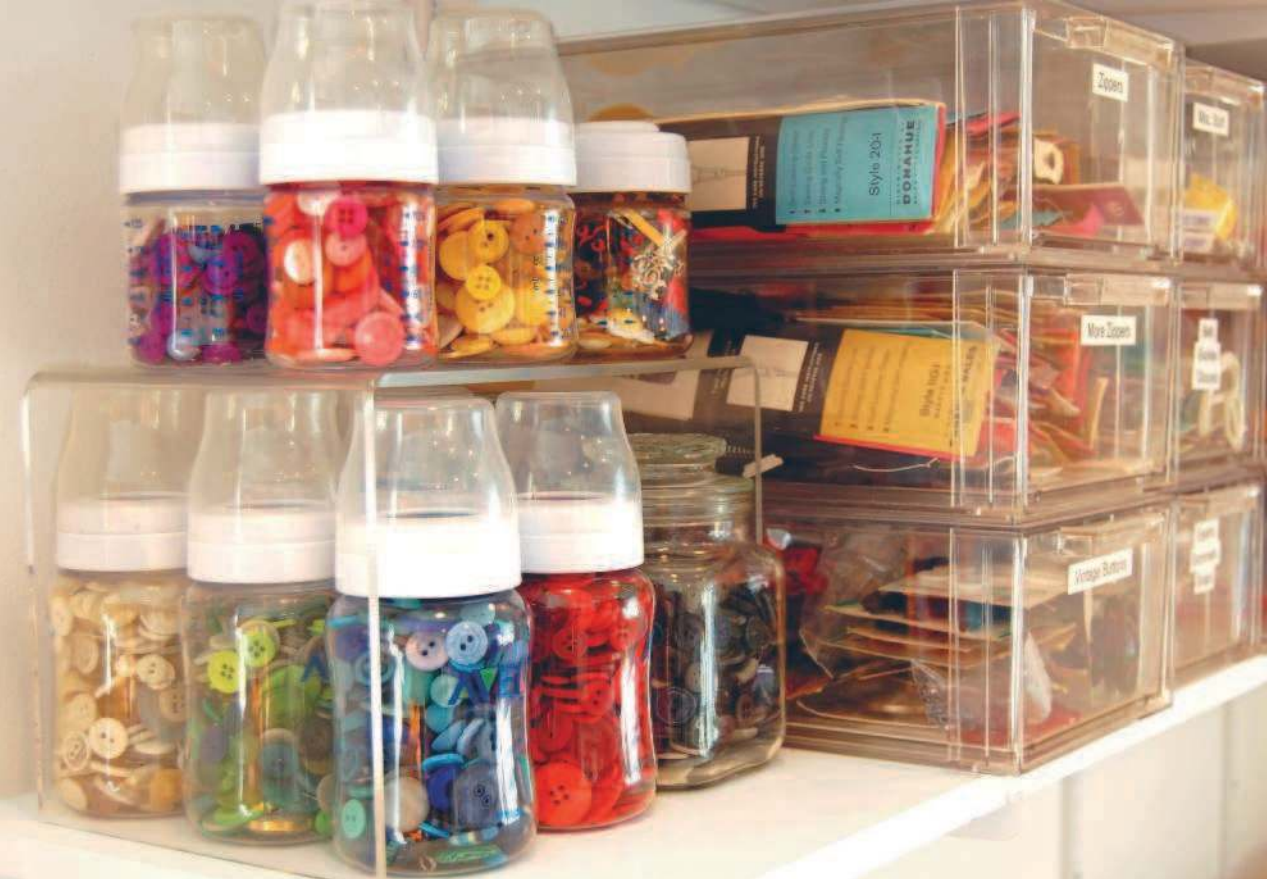
Детские бутылочки и старые банки отлично подходят для тесьмы и пуговиц.