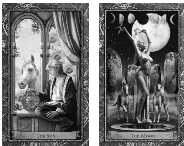
Солнце в Рыбах

Какая карта из Старших Арканов соответствует вашему знаку Солнца? Как две карты — Солнце и его знак — дополняют или отрицают друг друга? Как они описывают вашу личность, индивидуальность и самовосприятие? Что вы можете узнать из своего первого расклада по Таро и астрологии?