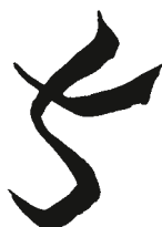
Рис. 5. Китайская пиктограмма.