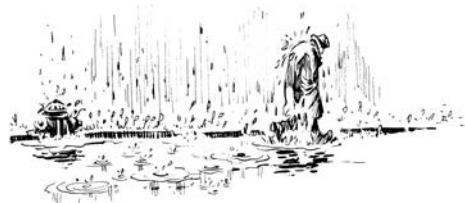
Здесь леттеринг используется для создания «климата». Дизайн шрифтовой гарнитуры, испещренной струями дождя, превращает обычный шрифт в элемент, поддерживающий образ.

Водостоки переполнились, Вода захлестывала тротуары.