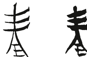
Китайские буквы (или пиктограммы), нарисованные двумя стилями мазков.

В комиксе привнесение своего стиля, индивидуальная манера использования контура, нажима, закраски может подчеркнуть красоту изображаемого объекта и смысл высказывания.