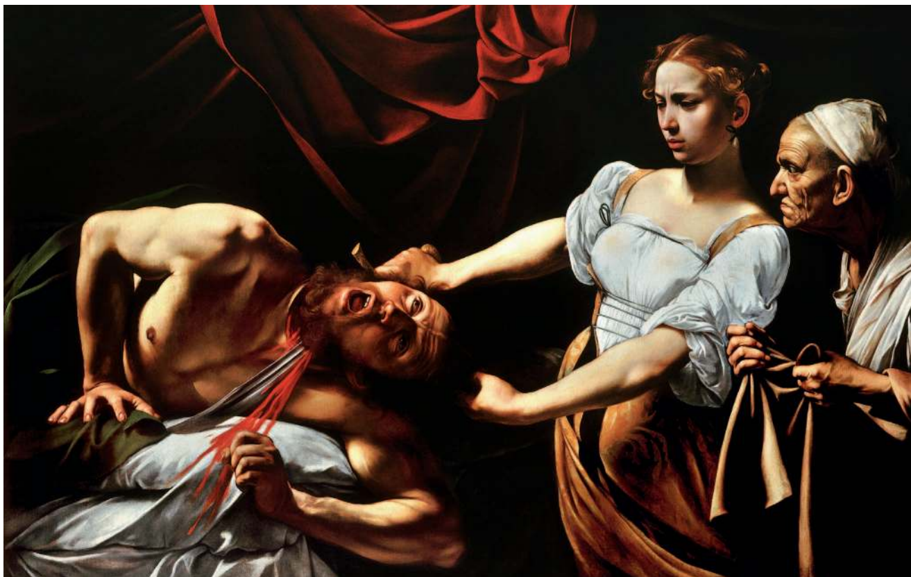
▲ 01 «Юдифь и Олоферн», Караваджо (ок. 1599)

В этом смысле гениальное использование Караваджо света позволяет изобразить психологическую драму ( иллюстрация 02 ). Такой подход сильно противоречил безвременным и немного отстраненным работам его предшественников.