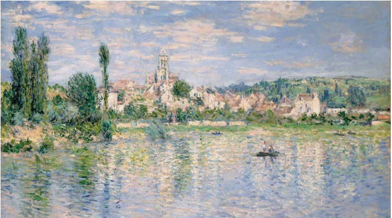
▲ 04 «Ветёр летом», К. Моне (1880)