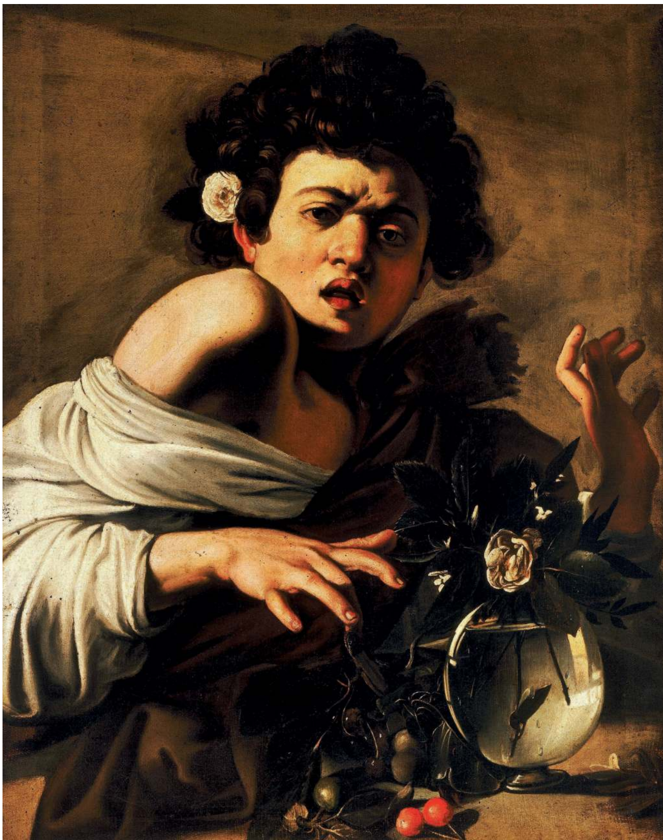
▲ 02 «Мальчик, укушенный ящерицей», Караваджо (ок.1600)