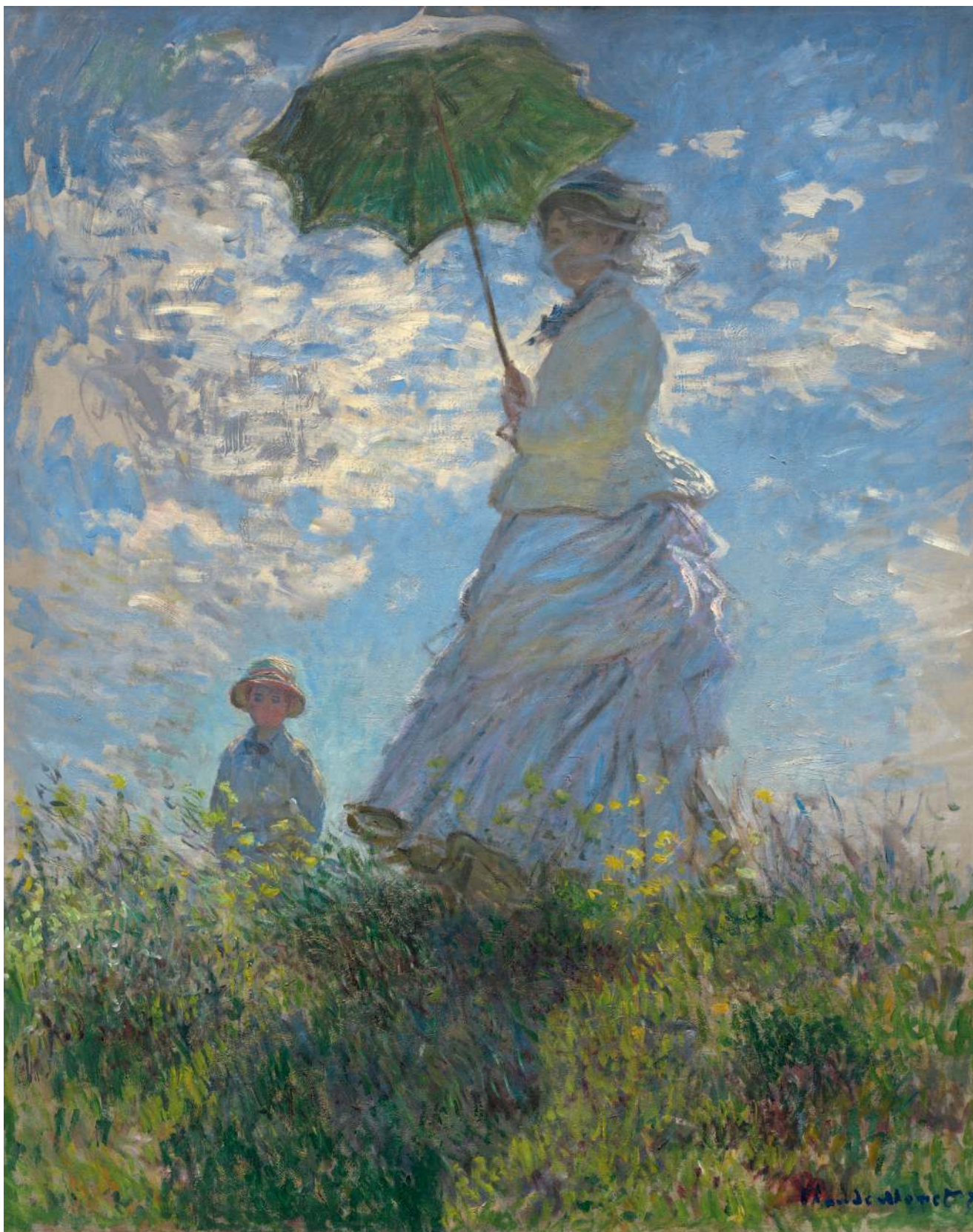
▲ 03 «Дама с зонтиком», К. Моне («Камилла Моне с сыном Жаном») (ок.1875)