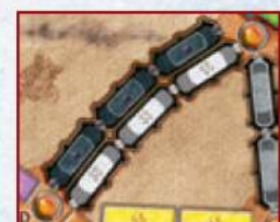
Двойной туннельный перегон (чёрно-белый) между Мадридом и Памплоной.

В тех редких случаях, когда в колоде и в сбросе нет трёх карт, игрок вскрывает все имеющиеся там карты. Если же игроки забрали все карты составов, и их не осталось ни в колоде, ни в сбросе, — туннель проходится без вскрытия карт, как обычный перегон.