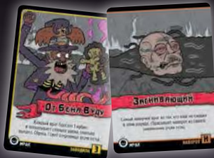
ЗАВОДИЛА + НАВОРОТ