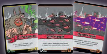
ЗАВОДИЛА + НАВОРОТ + НАВОРОТ