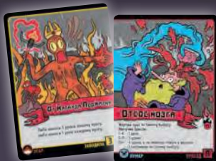
ЗАВОДИЛА + ПРИХОД