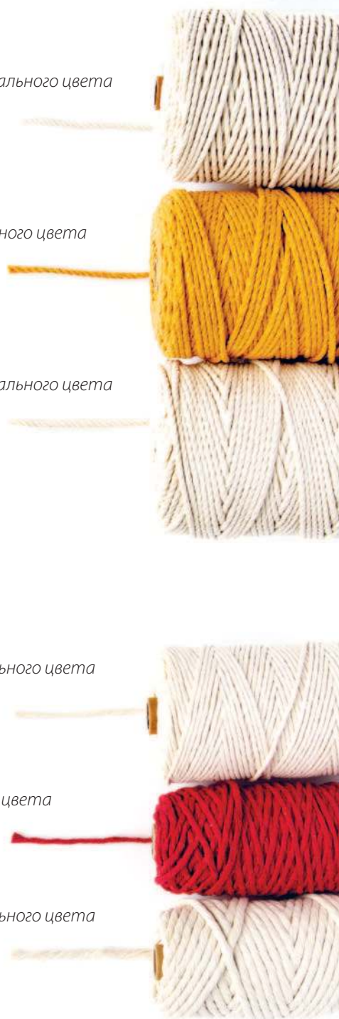
нить 7 мм натурального цвета