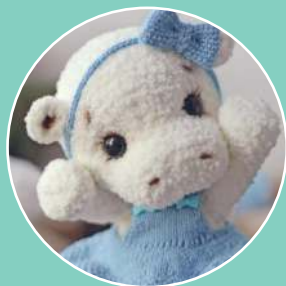
Бегемотик Эмма 76