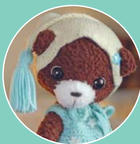
Мишка Бруно 40