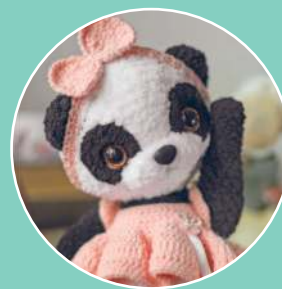
Панда Хляя 59