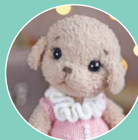
Собачка Мишель 163