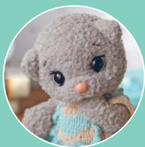
Кошечка Бетти 21