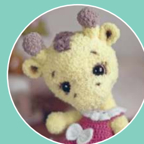
Жирафик Полли 129