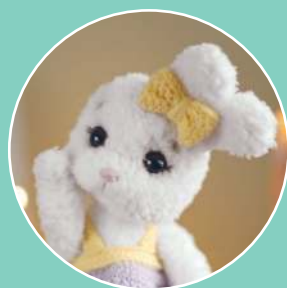
Зайка Мия 145