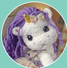
Единорожка Лили 93