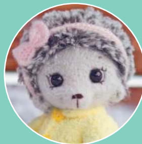
Ежик Софи 113