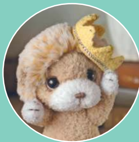
Львенок Лео 152